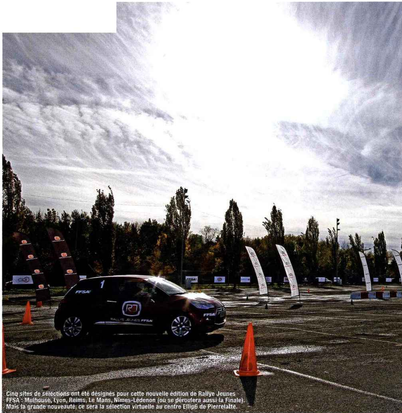
Cinq sites de sélections ont été désignés pour cette nouvelle édition de Rallye Jeunes FFSA : Mulhouse, Lyon, Reims, Le Mans, Nîmes-Lédénon (où se déroulera aussi la Finale). Mais la grande nouveauté, ce sera la sélection virtuelle au centre Ellip6 de Pierrelatte.